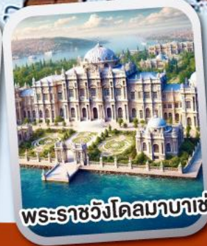
พระราชวังโดลมาบาเซ่