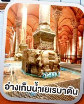
อ่างเก็บน้าเยรบาดัตัน