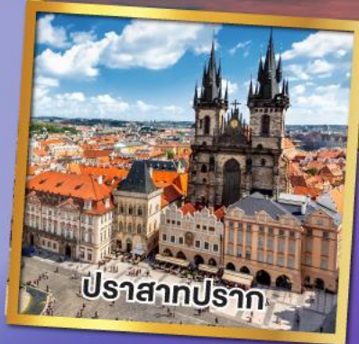
ปราสาทปราก