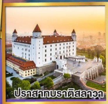
ปราสาทบราติสลาวา