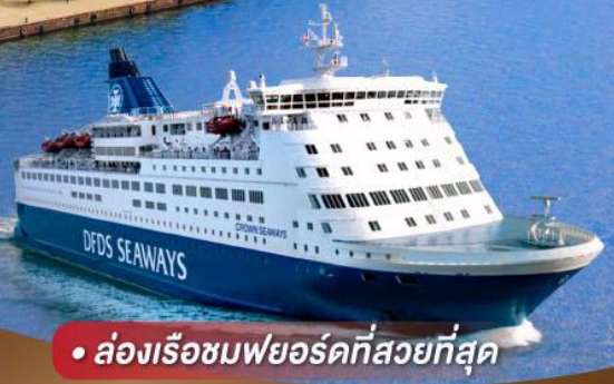
• ล่องเรือชมพยอร์ดที่สวยงามที่สุด