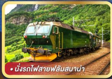
• นั้งรถไฟสายฟลั้มสบาน่า