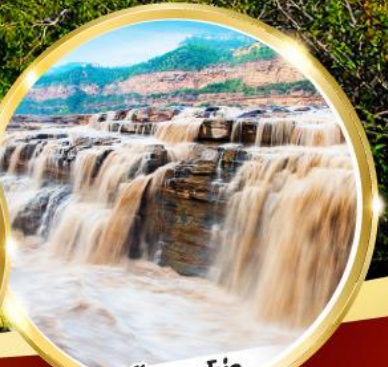
น้ำตกหูโง่ว