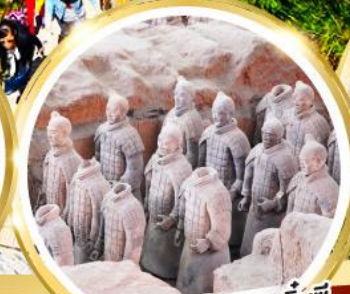
กองทัพทหารดินเผาจีนซี