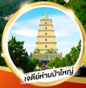
เจดีย์ห่านป่าใหญ่