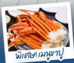
พิเศษ! เมฆหิมะ