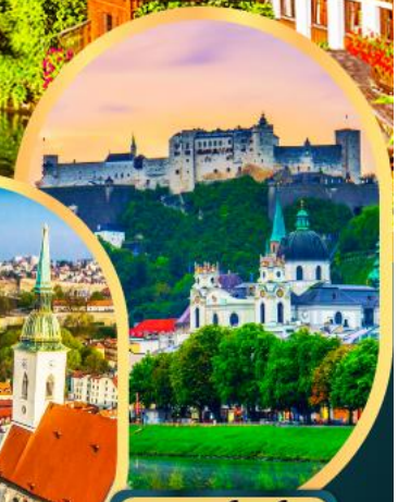
ซาลซ์บูร์ก