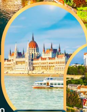
ล่องเรือแม่น้ำดานูบ