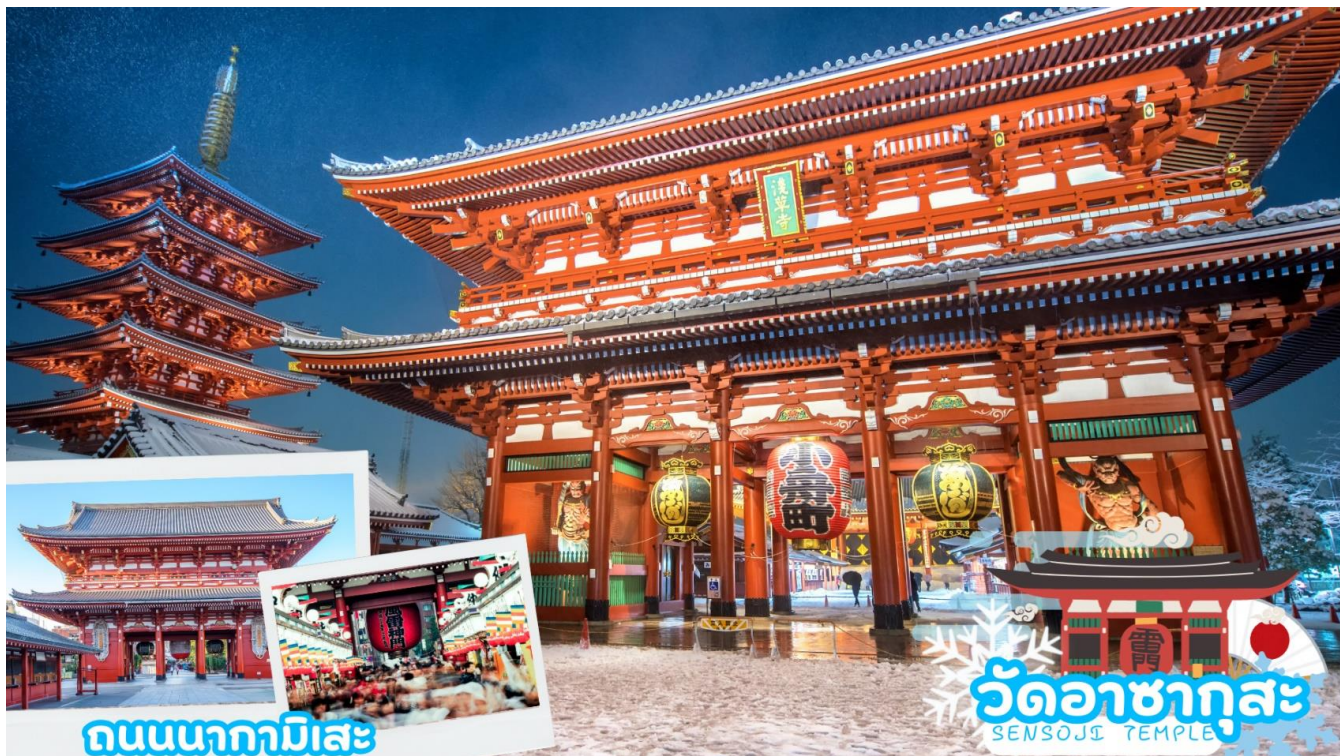
ถนนนากามิसे