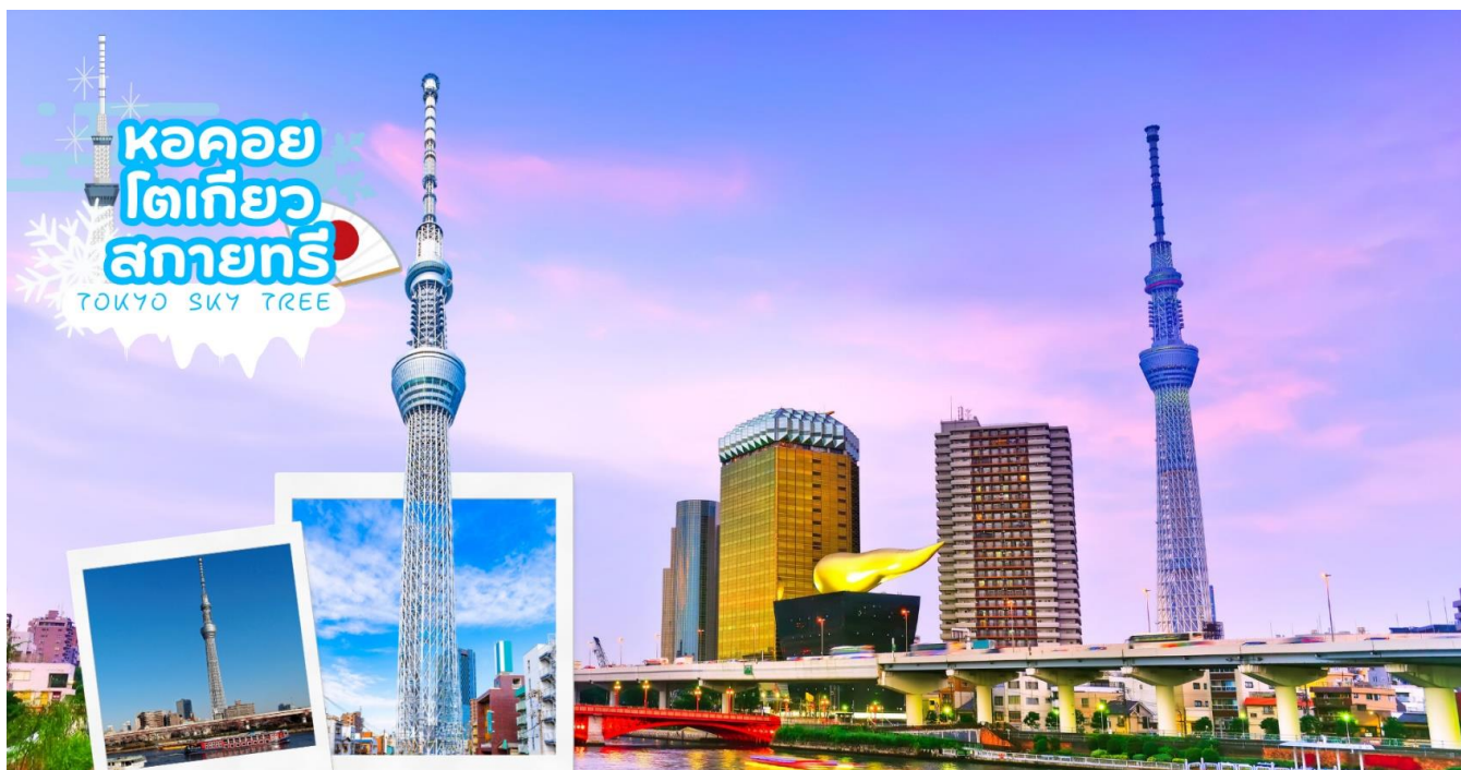
หอคอยโตเกียวสกายทรี TOKYO SKY TREE

เดินสูริรมแม่น้ำซูมิดะ อิสระให้ท่านได้ถ่ายรูปเก็บภาพความประทับใจหอคอยที่สูงที่สุดในโลก หอคอยโตเกียวสกายทรี (Tokyo Sky tree) ที่เปิดเมื่อ 22 พฤษภาคม 2555 มีความสูง 634 เมตร และสามารถทำลายสถิติความสูงของหอคอยต่าง ในมณฑลกว่างโจว ซึ่งมีความสูง 600 เมตร กับ CN Tower ในนครโตรอนโต ของแคนาดา ที่มีความสูง 553 เมตร