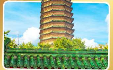
วัดพระเจี๊ยะเก้ว

เมนูพิเศษ เปิดปักกิ่ง, ซามูหม้อไฟ อาหารกวางตุ้ง, อาหารเสฉวน