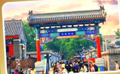
ถนนโบราณหนานหลิวกู่เซียง