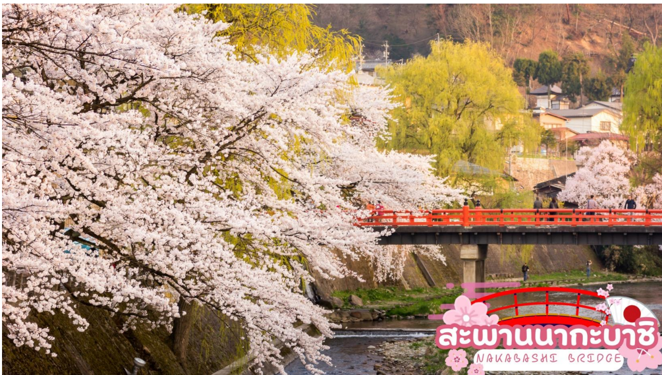
สะพานนากะบะชิ NAKABASHI BRIDGE

ผ่านชม ทาคายาม่า จินยะ หรือ ที่ว่าการอำเภอเก่าเมืองทาคายาม่า (ไม่รวมค่าเข้าชม) ซึ่งเป็นจวนผู้ว่าแห่งเมืองทาคายาม่า เป็นที่ทำงานและที่อยู่อาศัยของผู้ว่าราชการจังหวัดอิตะ เป็นเวลากว่า 176 ปี ภายใต้การปกครองของโชกุนตระกูลกุกาวา ในสมัยเอโดะ ตัวอาคารเป็นทั้งสถานที่ราชการ ห้องรับแขก ห้องประชุม รวมถึงห้องสอบสวนอีกด้วย