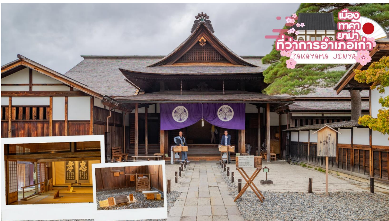
เมืองทาคายาม่า ที่ว่าการอำเภอเก่า TAKAYAMA JINYA

ผ่านชม ทาคายาม่า จินยะ หรือ ที่ว่าการอำเภอเก่าเมืองทาคายาม่า (ไม่รวมค่าเข้าชม) ซึ่งเป็นจวนผู้ว่าแห่งเมืองทาคายาม่า เป็นที่ทำงานและที่อยู่อาศัยของผู้ว่าราชการจังหวัดอิตะ เป็นเวลากว่า 176 ปี ภายใต้การปกครองของโชกุนตระกูลกุกาวา ในสมัยเอโดะ ตัวอาคารเป็นทั้งสถานที่ราชการ ห้องรับแขก ห้องประชุม รวมถึงห้องสอบสวนอีกด้วย