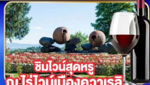
ชิมไวน์สุดหรู ณไร่องุ่นเมืองควาเรลี