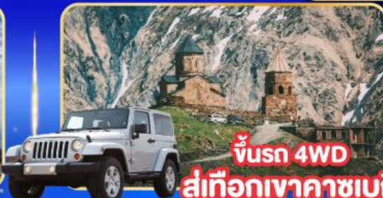
ขั้รถ 4WD สู่เทือกเขาคาซเบที้