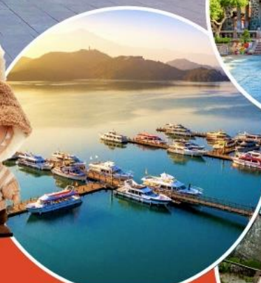
ทะเลสาบสุริยอันจันทร์