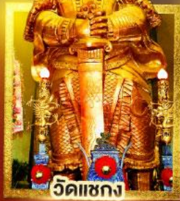
วัดไผ่ขวาง