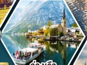
ล่องเรือ ทะเลสาบอัลสติก