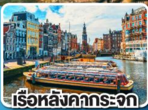
เรือหลังคากระจก