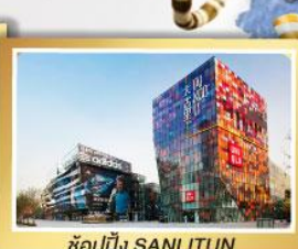
ช้อปปิ้ง SANLITUN