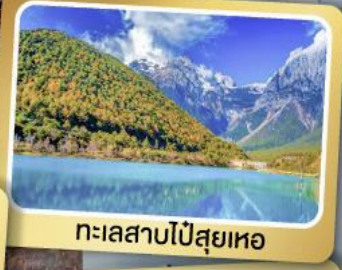
ทะเลสาบไป๋สุยเหอ