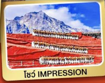
โชว์ IMPRESSION 5 ชม