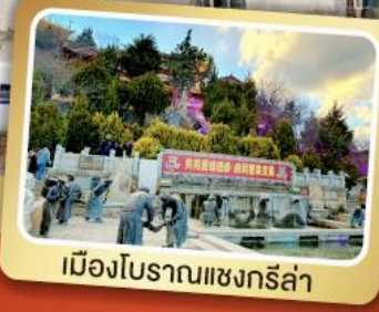
เมืองโบราณแชนกรีล่า