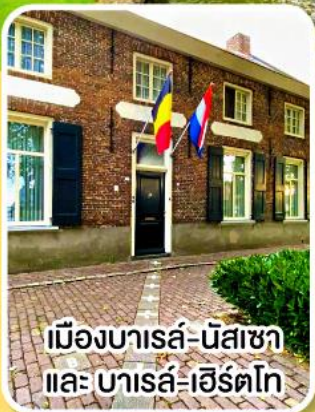
เมืองบารส์-นัสซา และ บารส์-เฮิร์ตโก