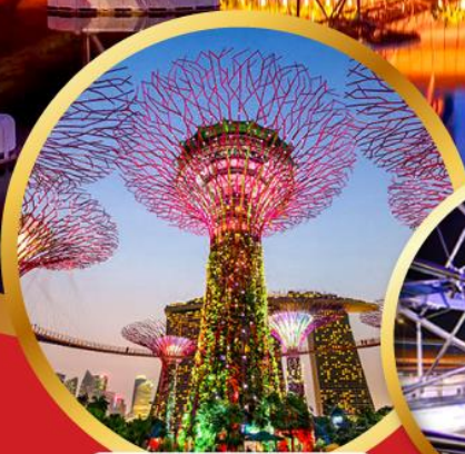
การ์เด้นส์ บาย เดอะ เบย์