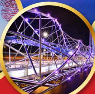
สะพานเกลียวเฮลิคซ์