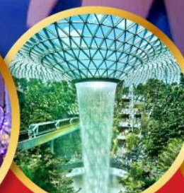
สนามบินชางงี