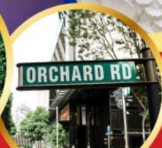
ถนนช้อปปิ้งออร์ชาร์ด