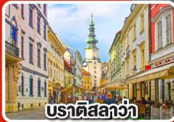
ปราติสลาวา

เที่ยวเมือง คาร์โลวารี เมืองแห่งสปา พร้อมเมนูพิเศษเปิดโบฮีเมีย