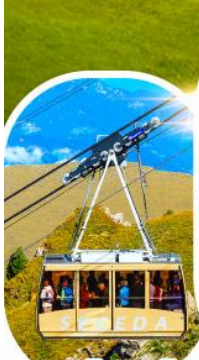
กระเช้าเซเคด้า