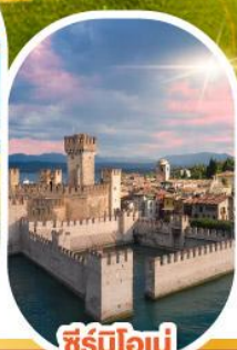
ซีร์มิโอเน่

เดินทาง 28 เม.ย.- 04 พ.ค. 68 30 พ.ค. - 05 มิ.ย. 68 11-17 มิ.ย. 68