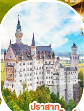
ปราสาท นอยชวานชไตน์