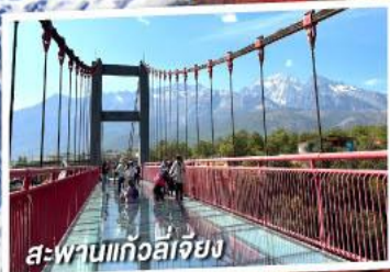
สะพานแกว่งลี่เจียง