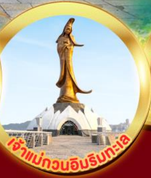
เจ้าแม่กวนอิมรินทระไล