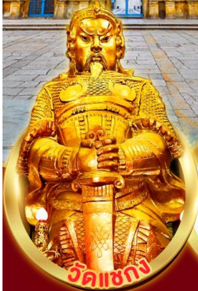
วัดแซกกง