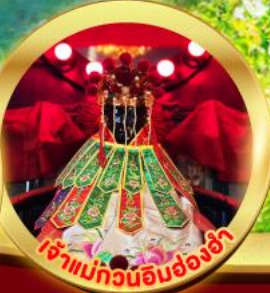
เจ้าแม่กวนอิมฮ่องงำ