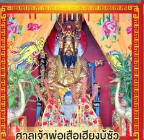
ศาลเจ้าพ่อเสือฮียงบูซิว