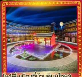
โชว์พื้นเมืองที่บ้านดินทุไหลว