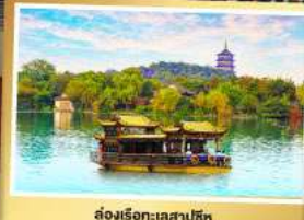
ล่องเรือชมวิวทะเลสาบซีหู