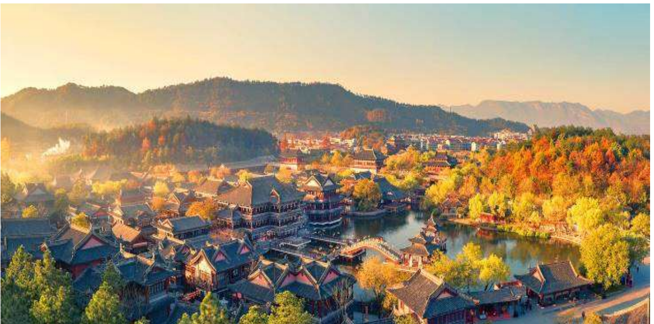
GO1HGH-CA003 หังโจว เติ้งเตี้ยน หวงหลง หุบเขาเทวดาวังเซียนกู่ 6วัน 4คืน โดยสายการบิน AIR CHINA (CA)