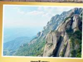
เขาหลิงซาน