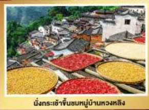
นั่งกระเช้าขึ้นชมหมู่บ้านหวงหลิง