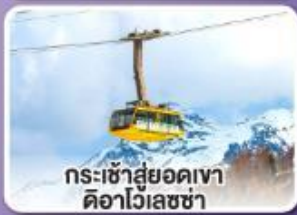
กระเช้าสู่ยอดเขา ดิวาไวเลซซา