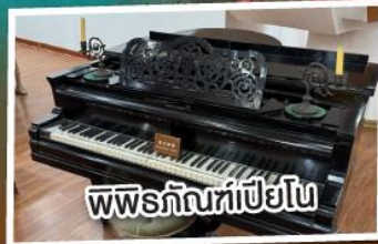
พิพิธภัณฑ์เปียโน

พัก 4 ดาว เมนูพิเศษ!!! เปิดปิ้งกั๊ง อาหารแต่จิว 18 อย่าง