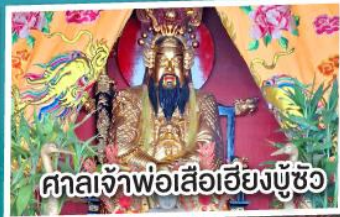
ศาลเจ้าพ่อเสือเฮียงบู๊ซิว