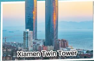
Xiamen Twin Tower