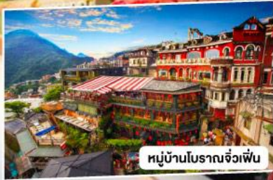
หมู่บ้านโบราณจั๋วเฟิ่น