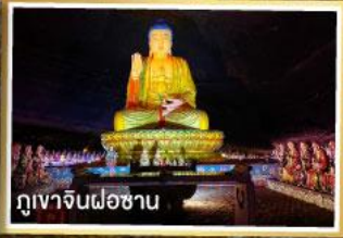
ภูเขาจินฝอซาน