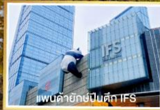
แพนด้ายักษ์ปีนตึก IFS