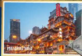
หยงหย่าต้ง