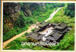
อุทยานหลุมบ่อฟ้า