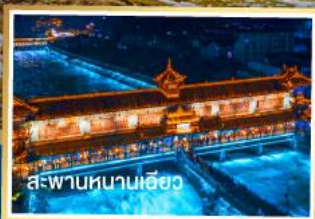
สะพานหนานเจียว