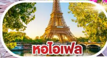
ทอคอยไอเฟล

ฝรั่งเศส สวิตเซอร์แลนด์ ทานอาหารบนทอคอยไอเฟล 10 วัน 7 คืน