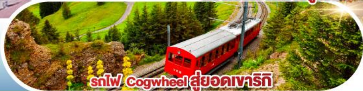
รถไฟ Cogwheel สู้ออดเวาริก

เดินทาง 01-10 เม.ย. 68 / 30 เม.ย. - 09 พ.ค. 68 03-12, 04-13 พ.ค. 68