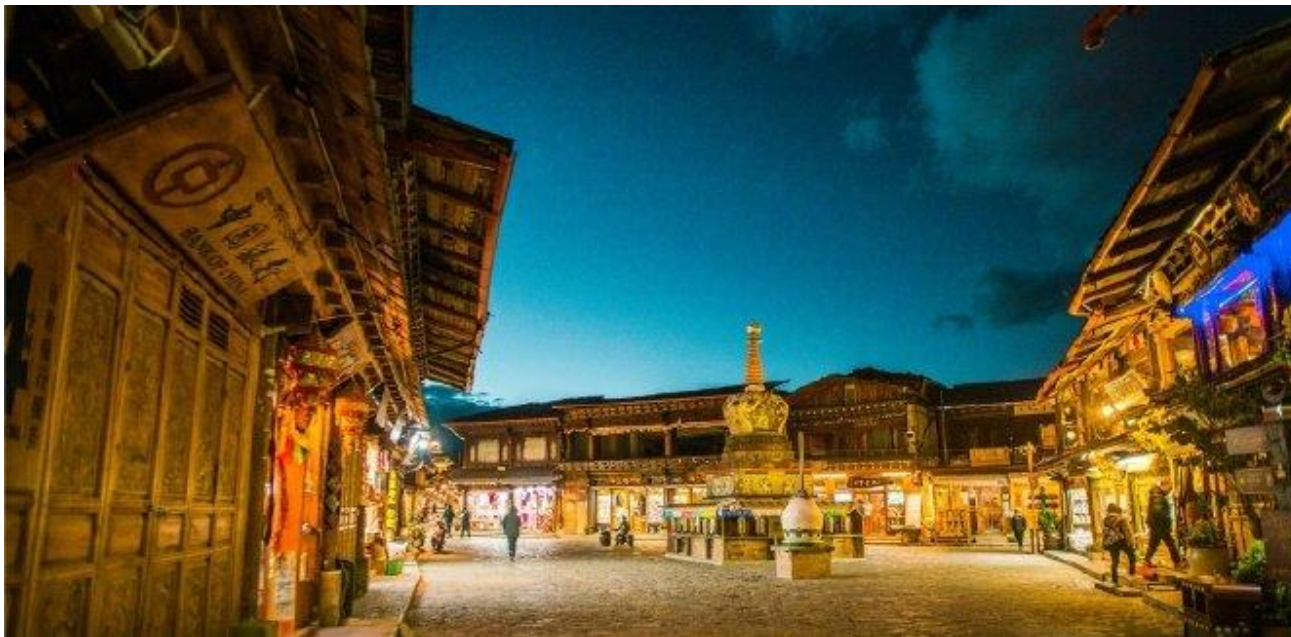
นำชม เมืองโบราณแห่งกรีกล่า หนึ่งในเมืองเก่าแก่ที่มีประวัติศาสตร์ยาวนานกว่า 1,300 ปี และเป็นสถานที่พักแรมสำคัญบน เส้นทางชา-ม้าโบราณ ซึ่งเชื่อมต่อยูนนานและทิเบต เมืองนี้สร้างขึ้นบนที่ราบลุ่มงตั้งโดยมีภูเขาเต่าใหญ่ (ต้ากู่ชาน) เป็นศูนย์กลาง โครงสร้างเมืองมีลักษณะกระจายเป็นรูปดอกบัวแปดกลีบตามหลักฮวงจุ้ยโบราณ ชื่อเดิมของเมือง"ตู๋เซ่อจง" เป็นภาษาทิเบต แปลว่า "เมืองแห่งแสงจันทร์" ตำนานเล่าว่าเมืองนี้เป็นจุดที่พระจันทร์ส่องสว่างงดงามที่สุดในแห่งกรีกล่า ตัวเมืองมีโครงสร้างสถาปัตยกรรมแบบทิเบตที่สมบูรณ์แบบที่สุดในยูนนาน บ้านเรือนทำจากไม้และหินวางเรียงกันอย่างเป็นระเบียบ และมีจัตุรัสกลางเมืองเป็นศูนย์กลางแห่งการค้าขาย เชิญท่านสักการะ วัดพระใหญ่ บริเวณด้านบนของวัด จะมีที่สักการบูชาพระทิเบต พร้อมกับการขอพรผ่านกงล้อมนตราขนาดใหญ่ ซึ่งเป็นกงล้อแห่งมนตราที่ใหญ่ที่สุดในโลก ตั้งอยู่บนยอดเขา ท่านสามารถหมุนกงล้ออธิษฐานขอพร พร้อมชมวิวเมืองโบราณและขุนเขาโดยรอบได้อย่างสุดตระการตา