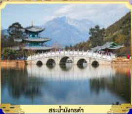
สะพานมังกรดำ