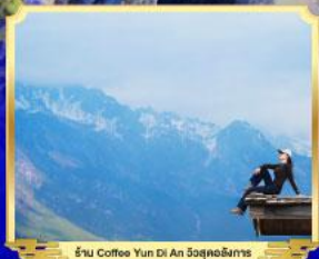
ร้าน Coffee Yun Di An 5จุดช้อปปิ้ง