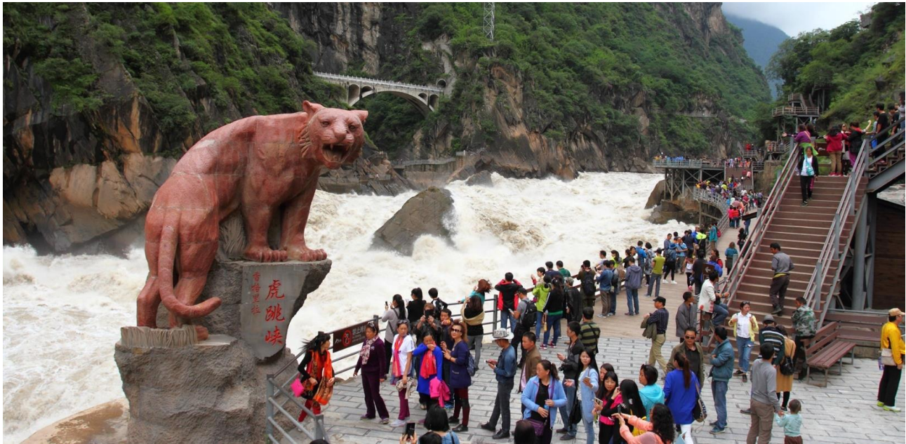
จากนั้นนำท่านแวะเก็บภาพประทับใจ ณ ร้านกาแฟ Moye Cliff Coffee ร้านกาแฟที่ตั้งอยู่บนยอดหุบเขาที่ไม่ไกลจากช่องแคบเสือกระโจน ที่มองข้ามผ่านหุบเขาสีดำตระหง่าน **ไม่รวมค่ากาแฟ**