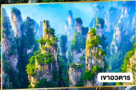
เวาอวดาร