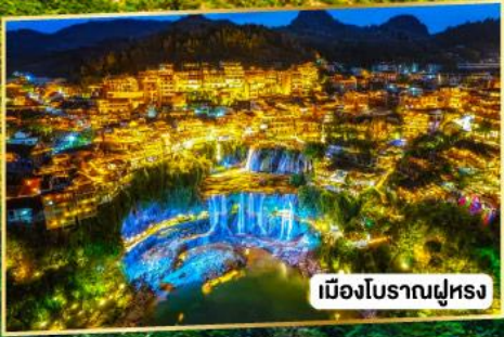
เมืองโบราณผุ่หลง

เที่ยวครบสองเขา เสน่ห์สองเมืองโบราณ ผุ่หลงเจิ่น เฟิ่งหวง 5 วัน 4 คืน