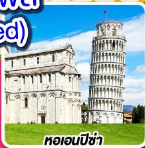
หอนอนปิซ่า