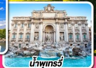
น้ำพุกรวี

04-13 ส.ค. 67 27 ส.ค. 67-05 ม.ค. 68 (ปีใหม่) 28 ส.ค. 67-06 ม.ค. 68 (ปีใหม่) 28 ม.ค.-06 ก.พ. 68