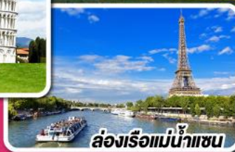
ล่องเรือแม่น้ำแซน