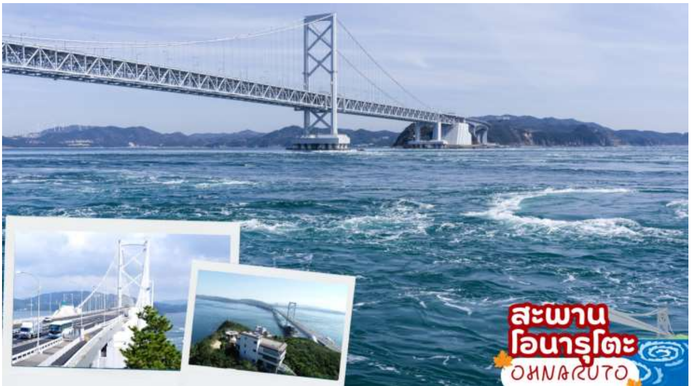
ผ่านชม สะพานโอนารุโตะ ( Ohnaruto ) เป็นอีกแห่งที่เหมาะสมสำหรับการชมน้ำวน จาก “Uzu-no-michi” ทางเดินทอดอยู่กั้นสะพาน นักท่องเที่ยวสามารถมองเห็นวิวเหนือมหาสมุทรแปซิฟิกและทะเลใน