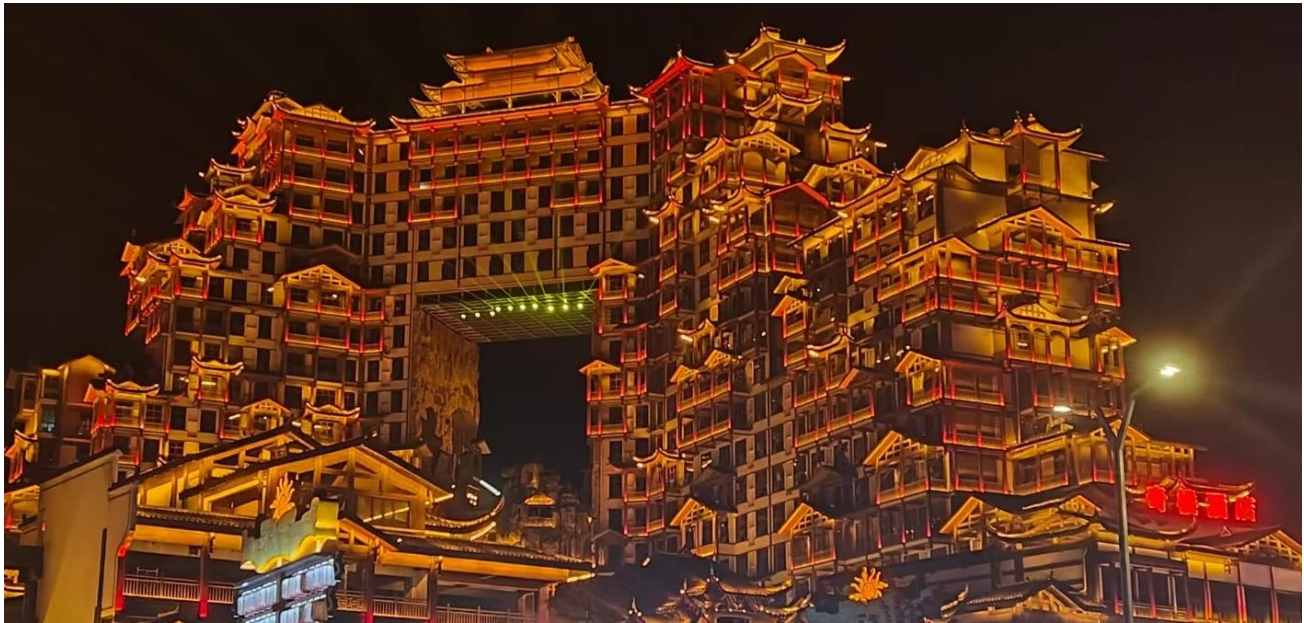
ที่พัก COUNTRY GARDEN PHOENIX HOTEL หรือเทียบเท่าระดับ 5 ดาว (มาตรฐานประเทศจีน)

วันที่สอง บ้านเจ้าเมืองถู่เจีย – เขาเทียนเหมินซาน (รวมกระเช้าขึ้นลง) – ระเบิดงิ้ว (รวมผ้าห่มรองเท้า) - บันไดเลื่อน 99 ชั้น - ถ้ำประตูลี้สุวรรค์ - โข่วจิ้งจอกขาว