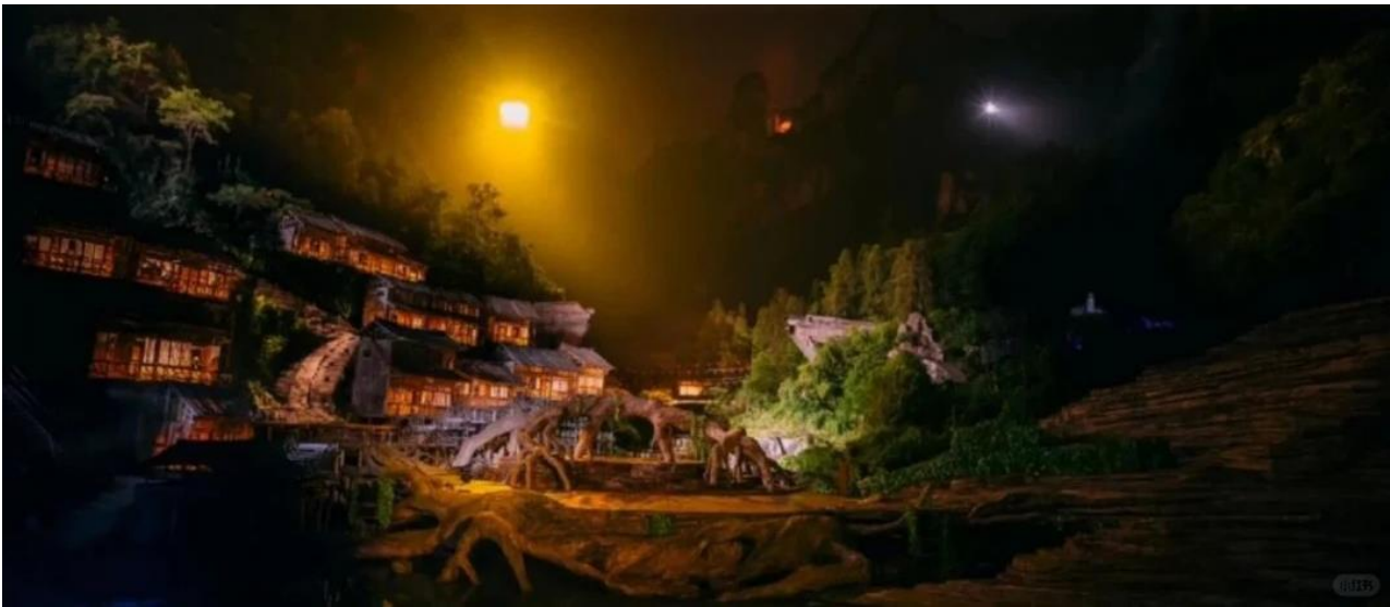
ที่พัก COUNTRY GARDEN PHOENIX HOTEL หรือเทียบเท่าระดับ 5 ดาว (มาตรฐานประเทศจีน)

หมายเหตุ หากวันเดินทางดังกล่าวทางโชว์งดการแสดง ทางบริษัทขอสงวนสิทธิ์เปลี่ยนเป็นโชว์เสน่ห์เซียงซีแทนหรือโชว์ ตำนานรักพันปี โดยไม่ต้องแจ้งให้ทราบล่วงหน้าและไม่มีการคืนค่าใช้จ่ายใดๆทั้งสิ้น