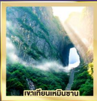
เขาคีเยนเหมินซาน