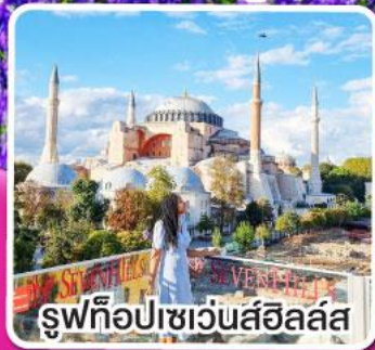
รูปทิวทัศน์เซนต์โซเฟีย