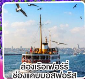
ล่องเรือเฟอร์รี่ ช่องแคบบอสฟอรัส