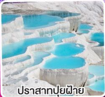
ปราสาทปุยฝ้าย

พิเศษ แลนด์มาร์กในฝัน สวนดอกทิวลิปหลากสีสุดจึ้ง