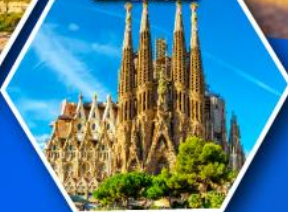
โบสถ์ซากราดา แฟมิเลีย