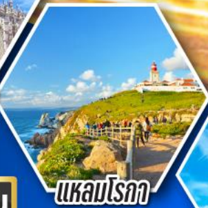
แหลมโรกา