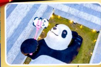
หมีแพนด้าขนนุ่ม