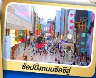
ช้อปปิ้งถนนซีลชีลู