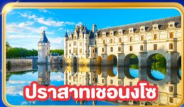
ปราสาทชองโซ