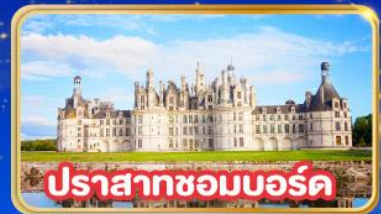
ปราสาทชอมบอร์ด์