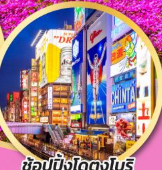
ช้อปปิ้งโดตงโบรี