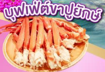
บุฟเฟ่ต์งาปูยักษ์

พิกโอซาก้า 2 คืน | แชน้ำแร่ธรรมชาติ ชมวิวฟูจิ ริมทะเลสาบคาวากูจิโกะ หมู่บ้านมรดกโลก ชิราคาวาโกะ