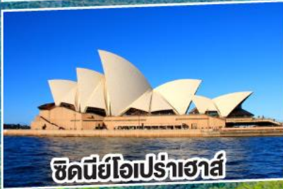
ชิดนีย์โอปรั้าฮาส์