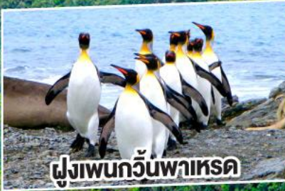
ฝูงเพนกวินพาทรด