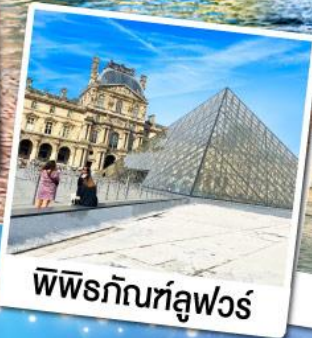
พีระมิดที่ลูฟวร์