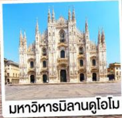
มหาวิหารมิลานดูโอโม

เมนูพิเศษ!! หอยเอสคาโก้ อาหารไทย, ฟองดูชีส