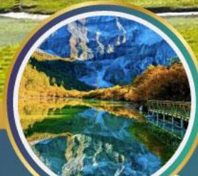
ทะเลสาบ 5 สี