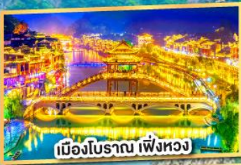
เมืองโบราณ เพิ่งหวง