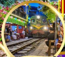
ร้านกาแฟฟรตโฟ