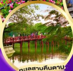
ทะเลสาบคินดาบ