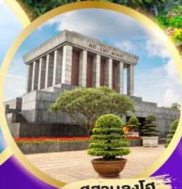
สุสานลุงโฮ