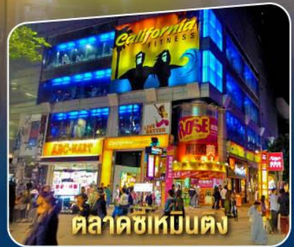
ตลาดซิเหมินตง