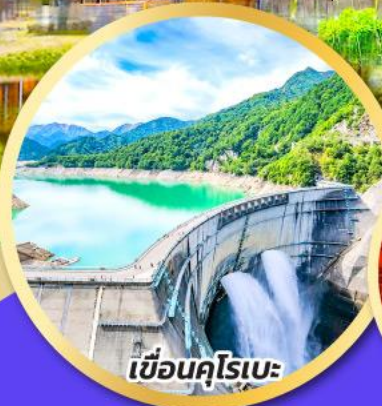
เชื้อนคุโรเบะ