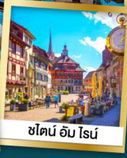
ชไตน์ อัม ไนน์