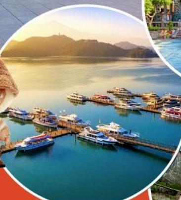
ทะเลสาบสุริยอันจันทร์