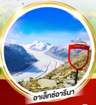
อาเล็ทซ์อาร์นา