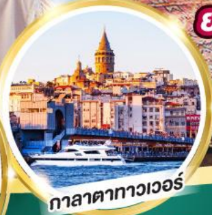
กาลาตาทาวเวอร์