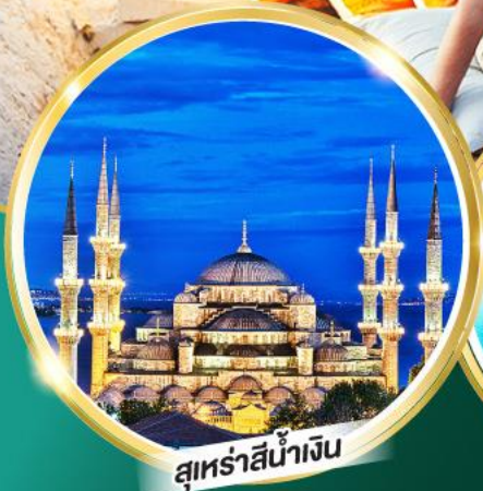
สุเหร่าสีน้ำเงิน

ฟรี!! พวงกุญแจ Evil Eye ชาเอ็ปเปิล,ไอศกรีมมาโก